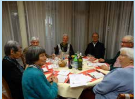
Repas des bénévoles, janvier 2020